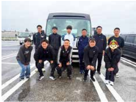
横須賀基地着隊のため移動中