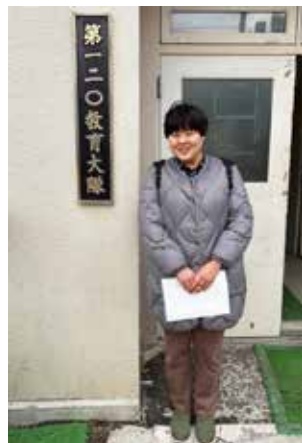
真駒内駐屯地へ着隊