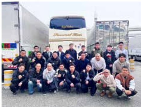
着隊のため武山駐屯地へ移動中