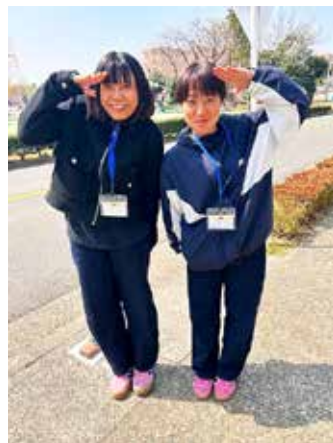
朝霞駐屯地へ着隊