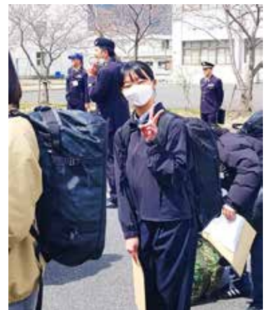
大津駐屯地へ着隊